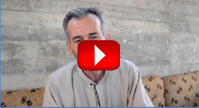
الشاهد الأول يروي ما حصل حول تفاصيل المجزرة