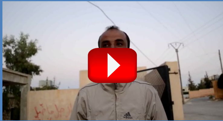
الشاهد الثاني يروي تفاصيل ما حصل حول المجزرة