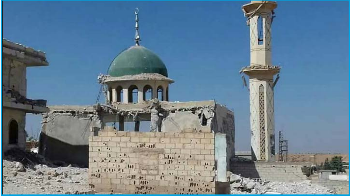
الدمار الناجم عن قصف قوات النظام السوري مسجد أبو بكر الصديق في قرية حمادة عمر/ حماة 9 / 8 / 2017

الجمعة 11 / آب / 2017 قصف طيران الحلف السوري - الروسي ثابت الجناح (ما زال قيد التحقق لتحديد الجهة الفاعلة) بالصواريخ مسجد عمر بن الخطاب في قرية سوحا التابعة لناحية عقيربات بريف محافظة حماة الشرقي؛ ما أدى إلى إصابة بناء المسجد بأضرار مادية كبيرة وخروجه عن الخدمة، تخضع القرية لسيطرة تنظيم داعش وقت الحادثة.