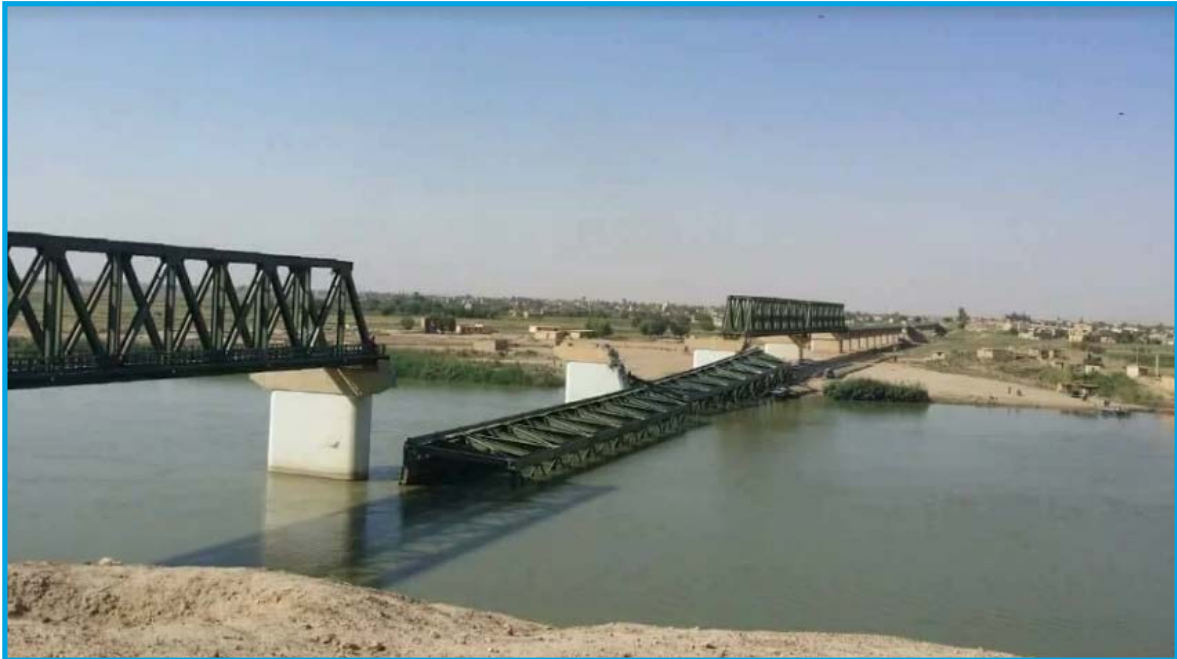
الدمار الناجم عن قصف قوات التحالف الدولي جسر الحديد في مدينة البوكمال/ دير الزور في 28 / 8 / 2017

الإثنين 28 / آب / 2017 قصف طيران ثابت الجناح تابع لقوات التحالف الدولي بالصواريخ جسر الحديد المعروف باسم جسر البقعان، الواصل بين قريتي الرمادي وأبو الحسن التابعتين لمدينة البوكمال بريف محافظة دير الزور الشرقي؛ ما أدى إلى دمار كبير في الجسر وخروجه عن الخدمة، تخضع المنطقة لسيطرة تنظيم داعش وقت الحادثة.