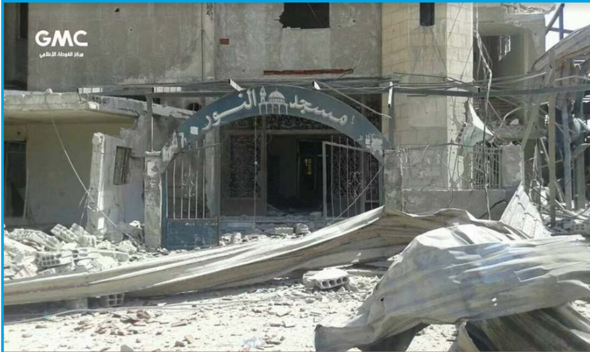
الدمار الناجم عن قصف قوات النظام السوري مسجد النور قرب بلدة حزة/ ريف دمشق 8 / 8 / 2017

الثلاثاء 8/ آب/ 2017 قصف طيران ثابت الجناح تابع لقوات النظام السوري بالصواريخ مسجد النور الواقع على الطريق الواصل بين بلدات حزة، زملكا، وعين ترما قرب بلدة حزة في الغوطة الشرقية شرق محافظة ريف دمشق؛ ما أدى إلى دمار جزئي في بناء المسجد، وإصابة أثاره بأضرار مادية كبيرة، تخضع البلدة لسيطرة فصائل المعارضة المسلحة وقت الحادثة.