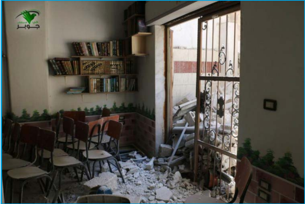
الدمار الناجم عن قصف قوات النظام السوري المركز الثقافي في عين ترما/ ريف دمشق 6 / 8 / 2017

الخميس 17 / آب / 2017 قصفت قوات النظام السوري صواريخ عدة من طراز فيل على المركز الثقافي في بلدة عين ترما في الغوطة الشرقية شرق محافظة ريف دمشق؛ ما أدى إلى دمار جزئي في بناء المركز وإصابة مواد إكسائه وأثاثه بأضرار مادية كبيرة وخروجه عن الخدمة، نشير إلى أن أهالي حي جوبر النازحين أنشأوا هذا المركز الثقافي الخاص بهم في البلدة، تخضع بلدة عين ترما لسيطرة فصائل المعارضة المسلحة وقت الحادثة.