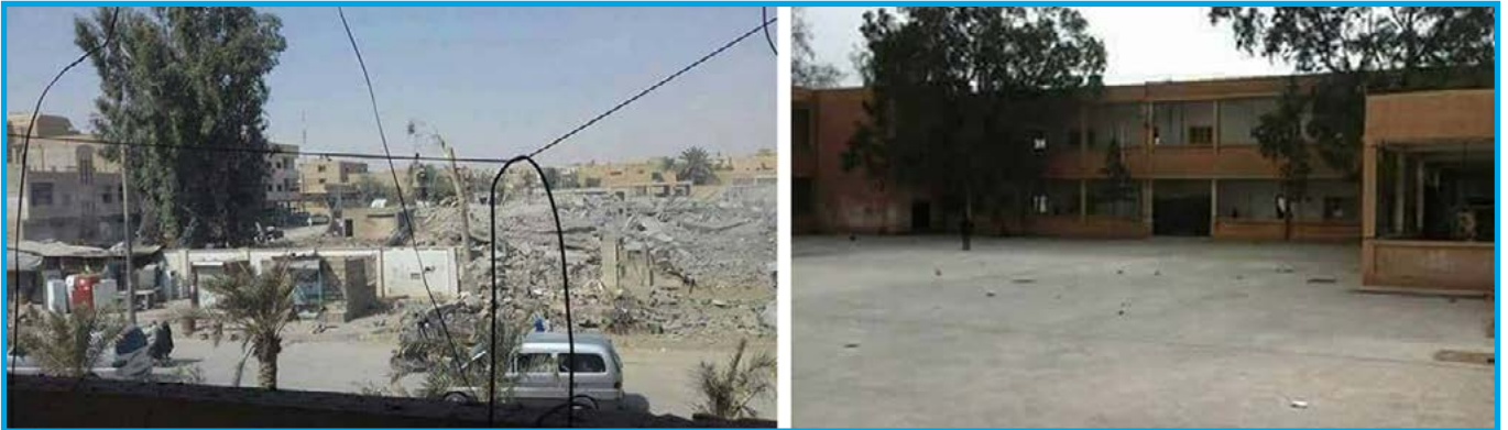
صورة تظهر مدرسة فايز منصور في مدينة البوكمال / دير الزور قبل وبعد تعرضها لقصف قوات التحالف الدولي 11 / 8 / 2017

الجمعة 11 / آب / 2017 قصف طيران ثابت الجناح تابع لقوات التحالف الدولي بالصواريخ مدرسة فايز منصور في مدينة البوكمال بريف محافظة دير الزور الشرقي؛ ما أدى إلى دمار بناء المدرسة بشكل كامل وخروجها عن الخدمة، تخضع المدينة لسيطرة تنظيم داعش وقت الحادثة.