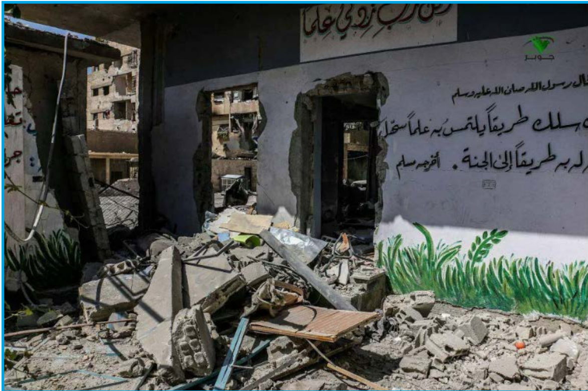
الدمار الناجم عن قصف قوات النظام السوري دار طوق الحمام للأيتام في حي جوبر/ دمشق 6/ 8/ 2017

الأحد 6/ آب/ 2017 قصف طيران ثابت الجناح تابع لقوات النظام السوري بالصواريخ دار طوق الحمام للأيتام في حي جوبر شرق مدينة دمشق؛ ما أدى إلى دمار جزئي في بناء الدار وإصابة مواد إكسائها وأثاثها بأضرار مادية كبيرة وخروجها عن الخدمة، يخضع الحي لسيطرة فصائل المعارضة المسلحة وقت الحادثة.