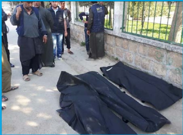
جثامين بعض ضحايا المجزرة التي ارتكبتها القوات الروسية في قرية الدير الشرقي / إدلب باستخدام الذخائر العنقودية في 29 / 3 / 2017

الأربعاء 29 / آذار / 2017 قصف طيران ثابت الجناح نعتقد أنه روسي 3 صواريخ محملة بدخائر عنقودية على مسجد عمر بن العزيز والمنطقة المحيطة به وسط قرية الدير الشرقي بريف محافظة إدلب الشرقي، أثناء تجمع عدد من المدنيين لشراء الخبز؛ ما أدى إلى مقتل 9 مدنيين، بينهم 5 أطفال وسيدة، وإصابة قرابة 20 آخرين بجراح، تخضع القرية لسيطرة مشتركة بين فصائل المعارضة المسلحة وتنظيم جبهة فتح الشام.