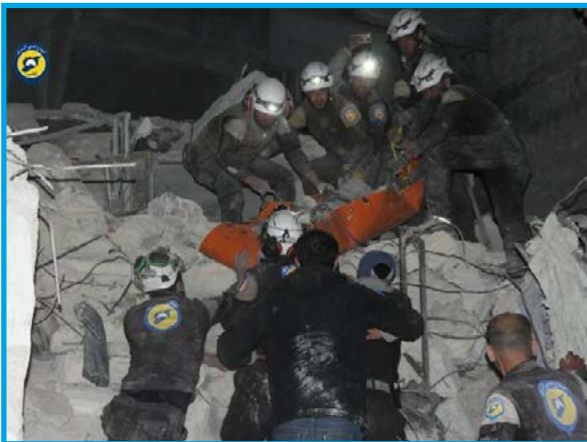
انتشال أحد ضحايا المجزة التي ارتكبتها القوات الروسية في مدينة جسر الشغور/ إدلب في 27/ 3/ 2017

الجمعة 24/ آذار/ 2017 قرابة الساعة 22:30 قصف طيران ثابت الجناح نعتقد أنه روسي بالصواريخ سجن النساء ضمن مبنى القوة الأمنية ”مبنى الأمن السياسي سابقاً“ وسط مدينة إدلب؛ ما أدى إلى مقتل 16 مدنياً، بينهم طفل و11 سيدة، وإصابة قرابة 10 آخرين بجراح، تخضع المدينة لسيطرة مشتركة بين فصائل المعارضة وتنظيم جبهة فتح الشام.