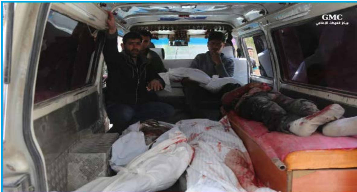
جثامين بعض ضحايا المجزرة التي ارتكبتها قوات النظام السوري في بلدة حمورية/ ريف دمشق في 25 / 3 / 2017

السبت 25 / آذار / 2017 قرابة الساعة 09:40 قصف طيران ثابت الجناح تابع لقوات النظام السوري 4 صواريخ على بلدة حمورية في الغوطة الشرقية شرق محافظة ريف دمشق؛ ما أدى إلى مقتل 17 شخصاً، بينهم 3 أطفال، و 7 سيدات، وإصابة نحو 70 آخرين بجراح، تخضع البلدة لسيطرة فصائل المعارضة المسلحة.