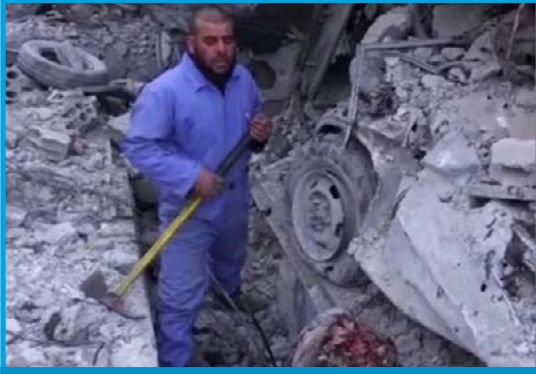
محاولة انتشال أحد ضحايا المجزرة التي ارتكبتها قوات التحالف الدولي في مغسل المنارة للسيارات في مدينة الطبقة/ الرقة في 21 / 3 / 2017

الثلاثاء 21 / آذار / 2017 قصف طيران ثابت الجناح تابع لقوات التحالف الدولي بالصواريخ مغسل المنارة للسيارات في مدينة الطبقة بريف محافظة الرقة الغربي؛ ما أدى إلى مقتل 6 مدنيين دفعة واحدة، بينهم طفل، تخضع المدينة لسيطرة تنظيم داعش.