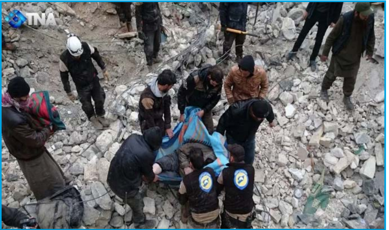
انتشال أحد ضحايا المجزة التي ارتكبتها قوات التحالف الدولي في مسجد عمر بن الخطاب في قرية الجينة/ حلب في 16 / 3 / 2017

مساء الخميس 16 / آذار / 2017 قصف طيران ثابت الجناح تابع لقوات التحالف الدولي بالصواريخ مسجد عمر بن الخطاب في قرية الجينة بريف محافظة حلب الغربي؛ ما أدى إلى مقتل 38 شخصاً، بينهم 5 أطفال وسيدة، تخضع القرية لسيطرة فصائل المعارضة المسلحة .