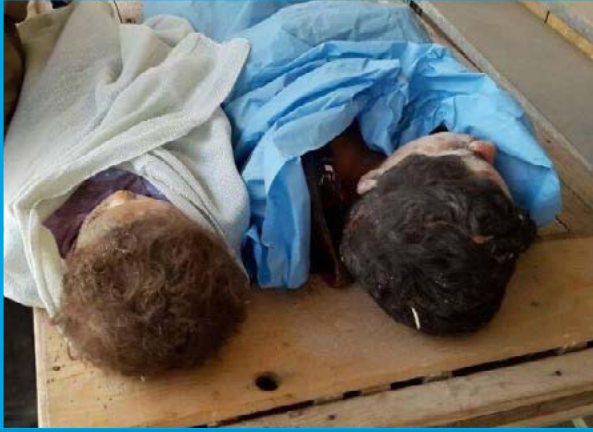
طفلان من ضحايا المجزرة التي ارتكبتها قوات النظام السوري في منطقة مسجد الأربعين بمدينة كفر نبل / إدلب في 9 / 3 / 2017

الخميس 9 / آذار / 2017 قرابة الساعة 08:00 قصف طيران ثابت الجناح (Su-24) تابع لقوات النظام السوري صاروخاً على المنازل السكنية في منطقة مسجد الأربعين وسط مدينة كفر نبل بريف محافظة إدلب الجنوبي، ما أدى إلى مقتل 5 مدنيين دفعة واحدة، بينهم 3 أطفال وسيدة، وإصابة قرابة 15 آخرين بجراح. تخضع المدينة لسيطرة مشتركة بين فصائل المعارضة المسلحة وتنظيم جبهة فتح الشام.