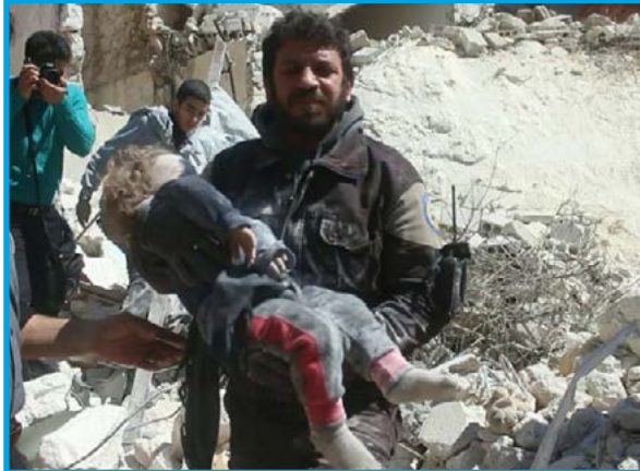
انتشال جنمان طفل من ضحايا المجزرة التي ارتكبتها قوات النظام السوري في شارع الأربعين بمدينة إدلب في 19 / 3 / 2017

الخميس 9 / آذار / 2017 قرابة الساعة 08:00 قصف طيران ثابت الجناح (Su-24) تابع لقوات النظام السوري صاروخاً على المنازل السكنية في منطقة مسجد الأربعين وسط مدينة كفر نبل بريف محافظة إدلب الجنوبي، ما أدى إلى مقتل 5 مدنيين دفعة واحدة، بينهم 3 أطفال وسيدة، وإصابة قرابة 15 آخرين بجراح. تخضع المدينة لسيطرة مشتركة بين فصائل المعارضة المسلحة وتنظيم جبهة فتح الشام.