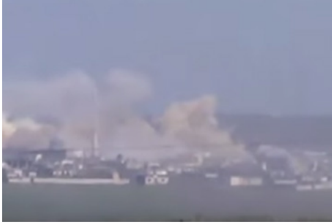
مقطع فيديو يظهر قصف طيران النظام الحربي صارح على قرية حر بنفسه بحماة في 1/ آذار/ 2016

سجلنا 3 خروق ارتكبتها القوات الحكومية في بلدة حر بنفسه، التي تخضع لسيطرة فصائل المعارضة المسلحة ولا تواجد لتنظيم داعش أو تنظيم جبهة النصرة في البلدة.