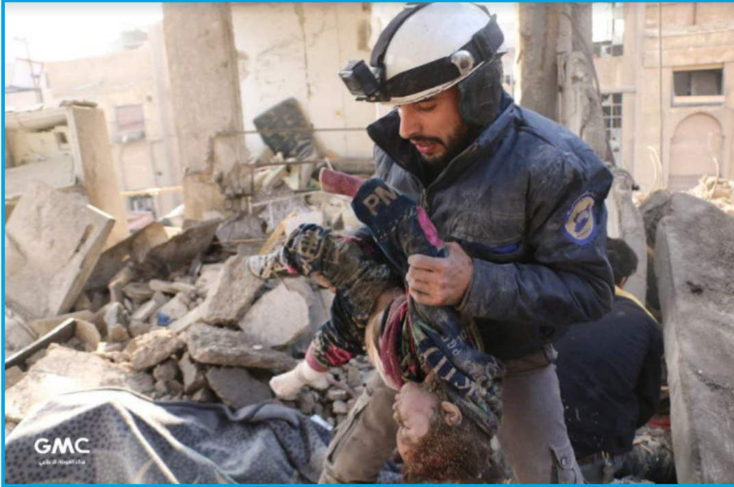
طفلة من ضحايا مجزرة ارتكبتها قوات النظام السوري في بلدة حمورية 6 / 1 / 2018

الإثنين 8 / كانون الثاني / 2018 قصفت مدفعية تابعة لقوات النظام السوري قذائف عدة على سوق شعبي في مدينة دوما؛ ما أدى إلى مقتل 12 مدنياً دفعة واحدة، بينهم 6 طفلاً و1 سيدة.