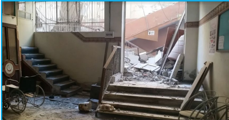
Image shows destruction in al Balsam Clinics Complex as Syrian-regime warplanes fired missiles on Hamouriya town in eastern Ghouta east of Damascus suburbs, on January 6, 2018

السبت 6/ كانون الثاني/ 2018 قصف طيران ثابت الجناح تابع لقوات النظام السوري بالصواريخ مجّمع عيادات البلسم في بلدة حمورية؛ ما أدى إلى إصابة بناء المجمع وتجهيزاته بأضرار مادية كبيرة وخروجه عن الخدمة.