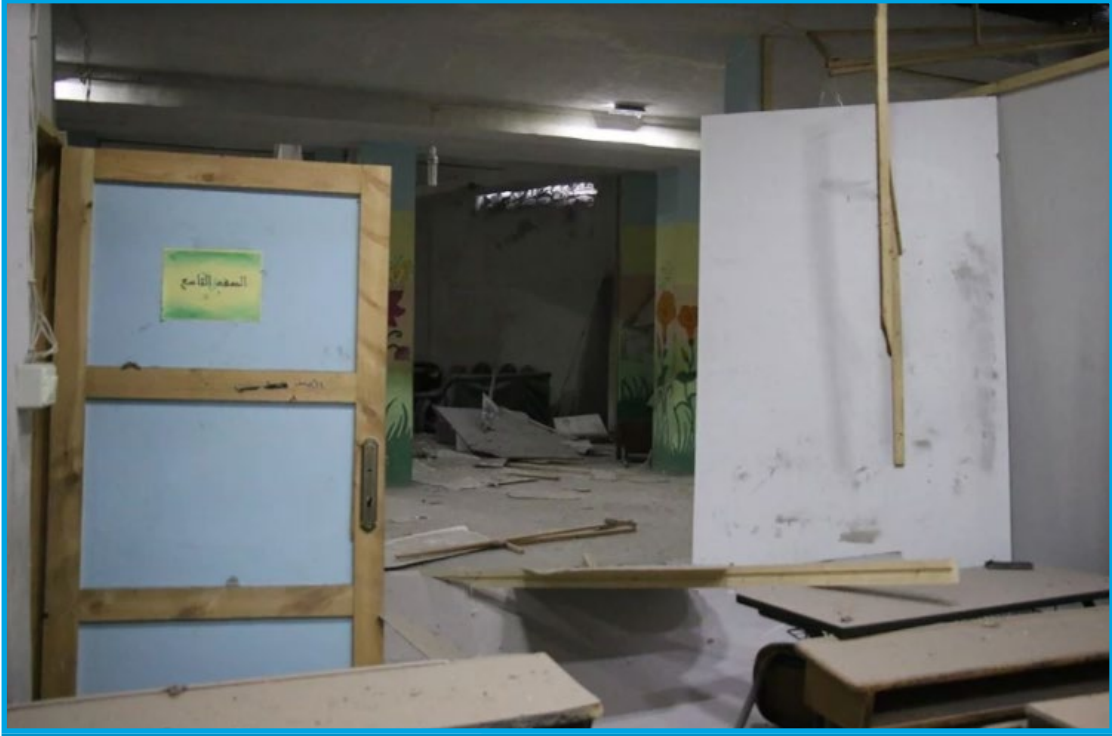
أضرار في مدرسة سنابل الفسطاط إثر قصف طيران النظام السوري/ بلدة حمورية 3 / 12 / 2017

الجمعة 5/ كانون الثاني/ 2018 قصف طيران ثابت الجناح تابع لقوات النظام السوري/ روسي (لا يزال قيد التحقق لتحديد الجهة الفاعلة) بالصواريخ ثانوية عربين للإناث في مدينة عربين؛ ما أدى إلى دمار كبير في بناء الثانوية وإصابة أثارها بأضرار مادية كبيرة .