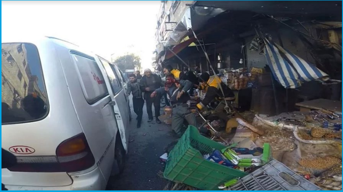
أضرار إثر قصف قوات النظام السوري سوقاً شعبياً في مدينة دوما 2018 / 1 / 2